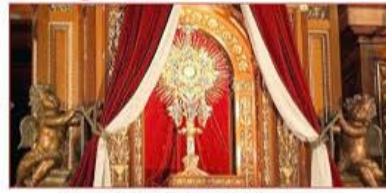
Come and spend time with our Eucharistic King!

Xin kính mời quý Ông Bà và Anh Chị Em, cùng tất cả các hội đoàn, ca đoàn trong Giáo xứ, nhóm hoặc cá nhân ghi danh 1 giờ Châu Thánh Thể theo lịch của Giáo xứ (có đề