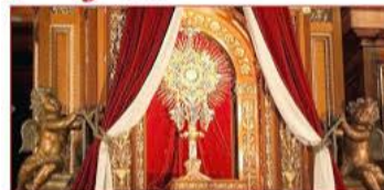
Come and spend time with our Eucharistic King!

Năm Thánh mời gọi chúng ta hướng về tương lai với niềm hy vọng và lòng tin tưởng vào kế hoạch của Thiên Chúa. Đồng thời, khuyến khích chúng ta sống một cuộc