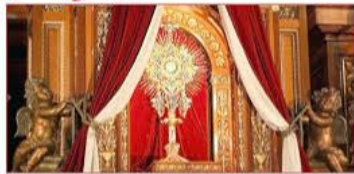
Come and spend time with our Eucharistic King!

Năm Thánh mời gọi chúng ta hướng về tương lai với niềm hy vọng và lòng tin tưởng vào kế hoạch của Thiên Chúa. Đồng thời, khuyến khích chúng ta sống một cuộc