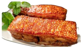
Heo quay giá $18/1lb

Giáo xứ sẽ bán heo quay và crawfish nhằm gây QUỸ PHÁT TRIỂN và BẢO TRÌ GIÁO XỨ.